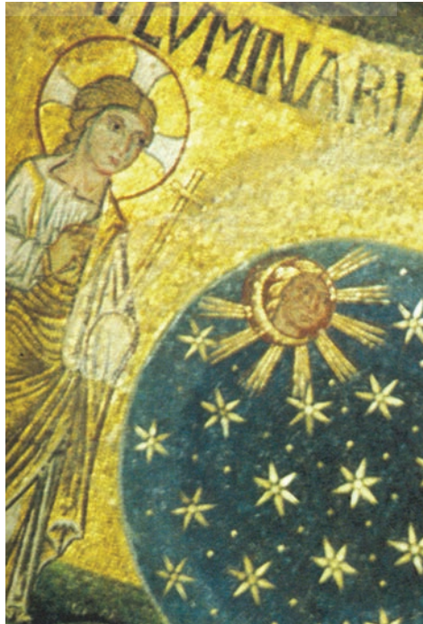
Crearea soarelui, lunii și stelelor (mozaic, Bazilica San Marco, Veneția, sec. XII)