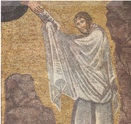
Moise primind tablele Legii (mozaic, Muntele Sinai, sec. VI)