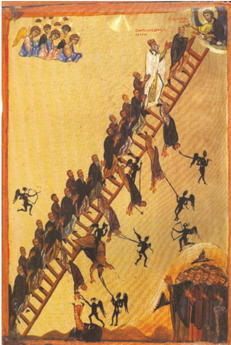
Scara Raiului (icoană, Muntele Sinai, sec. XII)

„Cu frică și cu cutremur lucrați la mântuirea voastră.” (Filipeni 2, 12)