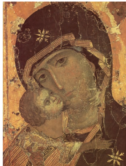
Maica Domnului din Vladimir (icoană, Rusia, sec. XII)