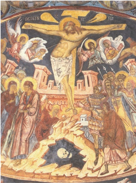
Răstignirea lui Iisus (frescă, Mănăstirea Probota, sec. XVI)

„Fiul Omului n-a venit să I se slujească, ci El să slujească și să-Și dea viața răscumpărare pentru mulți.” (Matei 20, 28)