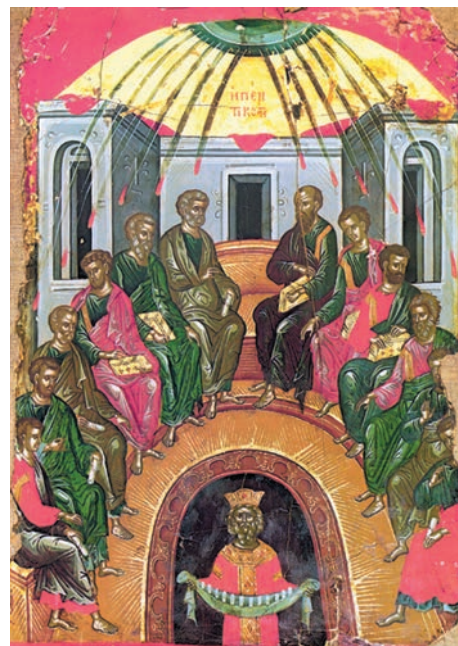
Pogorârea Duhului Sfânt (icoană bizantină, Muntele Athos, sec. XV)

„De la Duhul Tău, unde mă voi duce? Iar de la fața Ta, unde voi fugi? De mă voi pogori în iad, Tu ești de față; de-mi voi lua aripile din lumina zorilor și-n marginea mării mă voi sălășlui, chiar și acolo mâna Ta mă va îndruma și dreapta Ta mă va ține.” (Psalmul 138, 7-10)