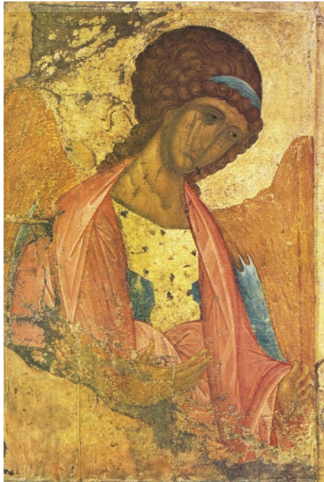
Sfântul Arhanghel Mihail (icoană, Andrei Rubliov, sec. XV)

„Pentru că întru El au fost zidite toate, cele din ceruri și de pe pământ, cele văzute, și cele nevăzute, fie Tronuri, fie Domnii, fie Începătorii, fie Stăpânii. Toate prin El și pentru El s-au zidit și El este mai înainte decât toate, și toate întru El se țin împreună.”