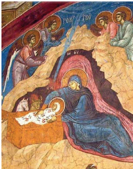
Nașterea Domnului (frescă, Mănăstirea Decani, sec. XIV)

„Suntem veșnic ispitiți a uita că de la trecerea Domnului Hristos prin lume, ontologic trăim, ne mișcăm și suntem într-o cu totul nouă ordine spirituală. Este un adevărat nou Univers spiritual acela în care respirăm noi astăzi și nu-i un lucru fără importanță dacă suntem sau nu conștienți de această adâncă realitate.”