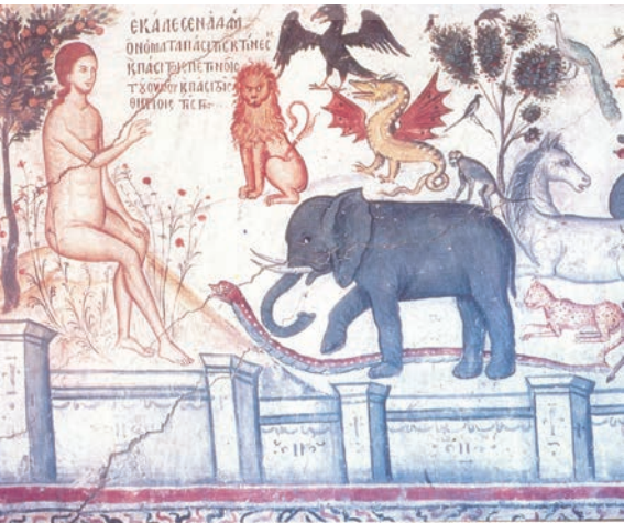
Adam numind animalele (frescă de Teofan Cretanul, sec. XVI)

„Nu există decât o idee supremă: că sufletul omenesc e nemuritor; toate celelalte idei profunde prin care trăiesc oamenii nu sunt decât prelungirea ei.”