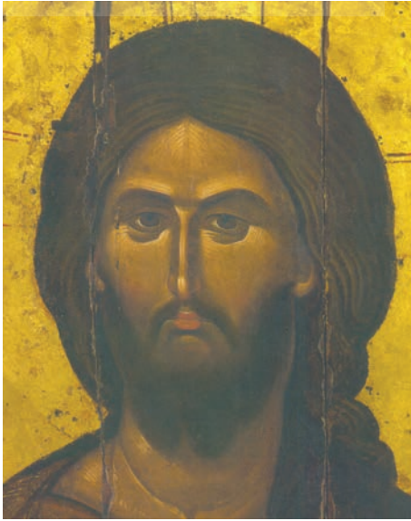
Mântuitorul Iisus Hristos (icoană, Muntele Athos, sec. XVIII)

„Biserica păstrează și transmite descoperirea dumnezeiască în Sf. Scriptură și Sf. Tradiție. În Sf. Scriptură, cuvântul lui Dumnezeu s-a transmis prin inspirația Sfântului Duh, iar în Sf. Tradiție, prin supravegherea și călăuzirea Aceluiași Duh Sfânt.”