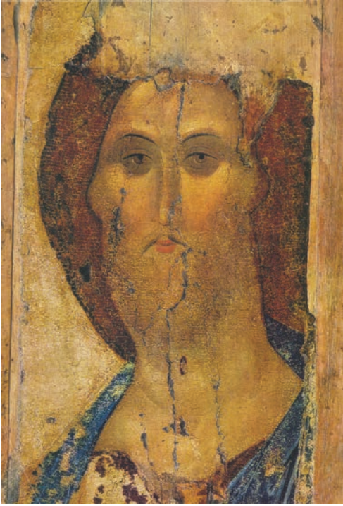
Iisus Hristos (icoană de Andrei Rubliov, sec. XV)

„Flămândul își închipuie că umblă după pâine și îi e foame de Tine; însetatul crede că vrea să bea apă și îi e sete de Tine; bolnavul se mângâie că râvnește sănătatea și boala lui nu-i decât lipsa Ta. Cine caută frumusețea pe lume Te caută, fără să-și dea seama, pe Tine, Cel ce ești frumusețea întreagă și desăvârșită; cine urmărește cu gândul adevărul Te dorește, fără voia lui, pe Tine, Cel ce ești singurul adevăr vrednic să fie cunoscut. (...) Venit-ai cea dintâi oară ca să mântui; născutu-Te-ai ca să mântui; lăsatu-Te-ai răstignit ca să mântui; îndeletnicirea-ți, fapta-ți, viața-ți e să mântui. Iar noi astăzi, în aceste zile cenușii și afurisite, în acești ani ce par a fi strâns în chenarul lor sporul tuturor grozăviilor și pătimirilor, avem nevoie, fără tăgadă, de a ne vedea mântuiți!”