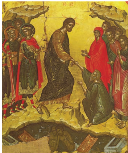
Învierea lui Hristos (frescă de Teofan Cretanul, Mănăstirea Stavronichita, Muntele Athos, sec. XVI)

„Nimeni să nu se tânguiască pentru păcate, că iertarea a strălucit din mormânt. Nimeni să nu se teamă de moarte, că ne-a slobozit pe noi moartea Mântuitorului (...) Unde-ți este, moarte, boldul? Unde-ți este, iadule, biruința?”