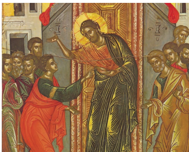
Toma atingând coasta Mântuitorului (frescă de Teofan Cretanul, Mănăstirea Stavronichita, Muntele Athos, sec. XVI)

Sfinții Apostoli, deși s-au arătat, inițial, neîncredători în Învierea Domnului, au ajuns să se convingă atât de puternic de acest adevăr, încât au murit propovăduindu-l.