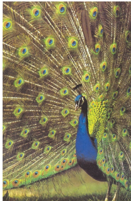
Creția mâinilor lui Dumnezeu: „Și a văzut Dumnezeu toate câte făcuse: și iată erau foarte frumoase” (Facere I, 31)

Ziua a V-a. Dumnezeu a făcut viețuitoarele din apă și din văzduh . Printr-o interpretare forțată, evoluționismul consideră că speciile derivă unele din